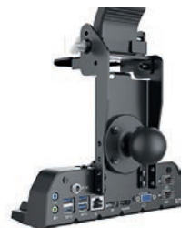
Station d'accueil mobile