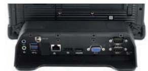
Station de bureau