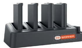
Chargeur de batteries